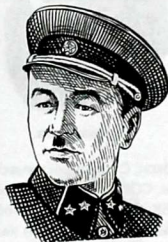
И. В. Панфилов

ПАНФИЛОВ Иван Васильевич (1892, Саратов облусу, Петровск ш.–1941) – Советтер Союзунун Баатыры (1942), генерал-майор (1940). 1918-жылдан Кызыл Армияда кызмат өтөп, Граждандык согушка (1918–20) катышкан. 1923-ж. Киевдеги бириккен жогорку аскер окуу жайын бүтүргөн. 1938–41-ж. Кыргыз ССРинин аскер комиссары. 1941-ж. июлдан Улуу Ата Мекендик согушта Түндүк-Батыш, Батыш фронтторунун 316-аткычтар дивизиясынын командири. Октябрь, ноябрь айларында анын дивизиясы Москваны коргоодо өлбөс-өчпөс эрдик көрсөткөн. Согушта курман болгон. Анын ысымы өзү командачылык кылган дивизияга ыйгарылган. Эстелиги Фрунзе (Бишкек) ш-нда орнотулган жана Чүй областынын бир району анын ысымы менен аталат.