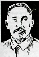
Осмонаалы Сыдык уулу

ОСМОНААЛЫ Сыдык уулу (1875–1940-жж.) – кыргыздын алгачкы тарыхчысы, агартуучусу. Кочкор өрөөнүндө сарыбагыш уруусунун ири манабы Абайылданын үй-бүлөсүндө туулган. Адегенде молдон билим алган. 1899-ж. Үч-Турпандагы жогорку мусулман мектеби – медреседен окуган. Ошол кезде эле кыргыздардын келип чыгышы боюнча материалдарды чогулткан. Кийин мусулман билиминин борбору Бухара жана Уфа шаарларында билимин өркүндөткөн. Уйгур, өзбек, татар, казак агартуучуларынын арасында жашаган. Орус тилин үйрөнгөн, европалык окумуштуулардын эмгектери менен да таанышкан.