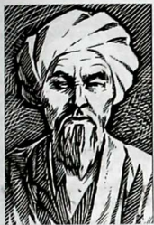
Зиядин Максым уулу

ЗИЯДИН Максым уулу. Зияутдин Магзуми – кыргыздын эу алгачкы тарыхчыларынан. Кыргыздын Дөөлөс уруусунан чыккан. Азыркы Ноокат районундагы Төөлөс айылында тулган. Кудаяр хандын ордосунда иш кагаздарын тейлеген. Хандын тапшырмасы менен 1666 беттен турган. «Фергана кандыгынын тарыхын» жазган. Кудаяр-хан тактан кулап, качкан соң, бул эмгек ээсиз калып, Түркиядан келген Абдрахман деген илимдүү адам алып кеткен. Кол жазма 1992-ж. Стамбул китепканасынан табылган. Тарыхый маалыматтар боюнча Зиядин Максым уулу Анжиян көтөрүлүшүнүн идеялык жетекчи болгон. 1898-ж. Анжиянга чабуул койгондо 80 жаштагы Зиядин Мадали менен бирге көтөрүлүшчүлөргө жетекчилик кылган.