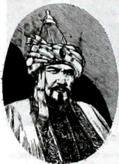
Сатук Буура Кара-хан

лерин бир нече ирет кыргыздарга жөнөткөн. Алп Солго арналган эпитафия Монголиядан табылган.