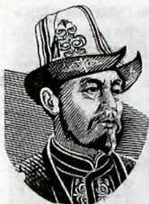
Мамыр Мерген уулу

МАМЫР Мерген уулу – Экисуу арасындагы Үчкоргон, Избаскен чөлкөмдөрүндө жашаган сол канат кыргыздарынын мундуз уруусунун карапайым үй-бүлөсүнөн чыккан инсан. 1873-ж. жаз айларында 35 жаштагы Мамыр Кудаяр ханга каршы Экисуу арасын, Көгарт өрөөнүн, Сузактан Өзгөнгө чейинки чөлкөмдөрдү туруктаган кыргыздардын мундуз, багыш, басыз, карабагыш жана кушчу урууларын көтөргөн. Көтөрүлүшчүлөр Жалалабат, Ханабат кыштактарын эзлешкен. Кыймыл тез эле Экисуу арасын толук каптаган. Июлда Мамырдын кошууну Өзгөн ш-н алган. Ал жетектеген көтөрүлүш бир топ кубаттуу болгондуктан, аны басууга Кудаяр хан өзү аттанган. Ал Анжиян ш-на келип, көтөрүлүшчүлөрдү талкалоого күчтүү жазалоочу