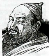
Үмөтаалы Ормон уулу