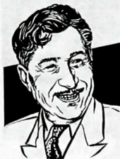
С. А. Чуйков

ЧУЙКОВ Семен Афанасьевич (1902–1980-жж.) – советтик живописчи, СССР эл сүрөтчүсү (1963). СССР Сүрөтчүлөр академиясынын анык мүчөсү (1968). СССР мамлекеттик сыйлыгынын (1949, 1951), Токтогул атындагы Кыргыз ССР мамлекеттик сыйлыгынын (1972). Индиянын мамлекеттик сыйлыгынын лауреаты. Верный, Москва шаарларында окуган. 1930-ж. башында Кыргызстан сүрөтчүлөр союзун, Фрунзедеги Кыргыз мамлекеттик сүрөт өнөр музейин уюштуруунун демилгечиси болгон. Кыргыз элинин турмушун, көлөмдүү көркөм формалар менен чагылдырган.